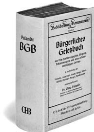
1. Auflage 1939

Die 1. Auflage umfasst XXII, 2194 Seiten.