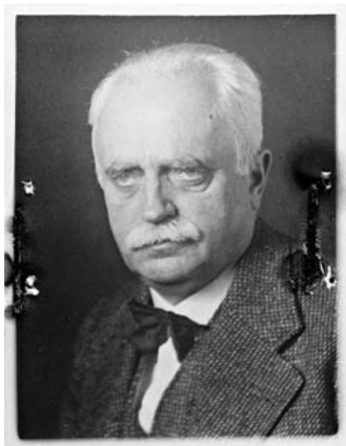
Otto Palandt, Foto aus seiner Personalakte im Bundesarchiv Berlin-Lichterfelde.

Dekoriert mit dem goldenen Treudienst-Ehrenzeichen I. Stufe und dem Kriegsverdienstkreuz 2. Klasse (ohne Schwerter – dies mutmaßlich nicht wegen des einst verweigerten Säbels) geht P. zum Februar 1943 in den Ruhestand, hält aber noch bis Juli freiwillig Lehrgänge für Referendare. In der Berliner Wohnung am Kaiserdamm ausgebombt, verschlägt es ihn ins Hannoversche, dann ins thüringische Oberhof, später nach Langensalza. Unverdrossen bittet er von der Provinz aus um Wiederverwendung im Justizdienst. Bald aber fegt die Geschichte seine linientreu rhetorischen Zweifel, ob »der Nationalsozialismus überhaupt einen Abschluß kennt und Nationalsozialismus und Abschluß nicht einen Widerspruch in sich bedeutet«, glücklich hinweg. Der »nationalsozialistische Staat, der stets so sehr mit Recht die menschliche Seite aller Dinge betrachtet«, 29 hatte sich doch allzu sehr auf die unmenschliche konzentriert.