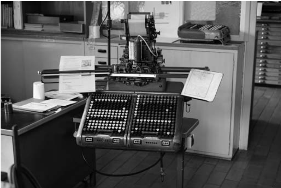
Monotaster zur Erfassung der Manuskripte.

Der Palandt wurde bis zur 24. A. (1965) noch in Frakturschrift gesetzt. Diese Schrift wurde zunehmend als altertümlich empfunden, bei Schulbüchern wurde sie längst nicht mehr verwendet. Früher oder später musste man der Entwicklung folgen und stellte auf eine besser lesbare Antiquaschrift (»Bembo«) um. Der erneute komplette Neusatz verursachte erhebliche Kosten. Der Laie macht sich oft falsche Vorstellungen wie der Preis eines Buches zustande kommt. Tatsächlich sind die Satzkosten oft der größte Kostenfaktor bei der Buchherstellung, nicht die Kosten für das Papier, den Druck oder die Bindung. Nachdem die Entscheidung für die kleinere, modernere Schrift getroffen war, war klar, dass mit der kompletten Neu-erfassung des Palandt nur die erfahrenen, mitdenkenden Setzer der eigenen Druckerei, die schon bei den Voraufagen den Palandt betreut hatten, beauftragt werden konnten. Natürlich können die Setzer die zu erfassenden Texte nicht vollends inhaltlich erfassen, doch im Laufe der Zeit haben sich diese die juristische Diktion, die Kürzelsprache und die besonderen Abkürzungen erarbeitet und spüren so noch