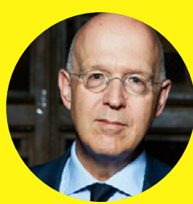
Markus Hartung Rechtsanwalt // The Law Firm Companion markushartung.com