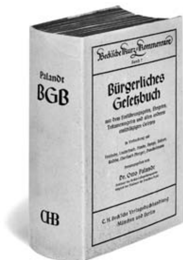
1. Auflage 1939

Die 1. Auflage umfasst XXII, 2194 Seiten.